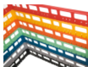
optie- bovenrand- clixrack-600