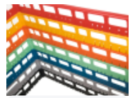
optie- bovenrand- clixrack-600