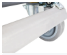
optie- isolatiecontainer- ergonomische- centrale-rem