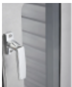
optie- isolatiecontainer- glazen-deur